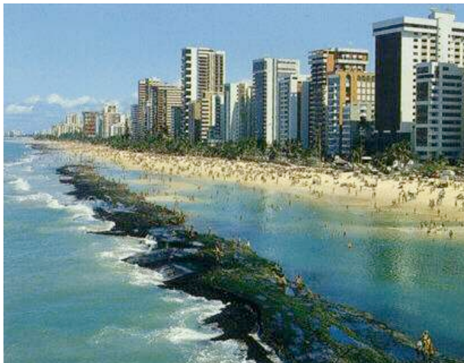
Figura 27. Boa Viagem, Recife, Brasil. Trata-se de uma mostra visual do lugar onde ocorrerá a XIII CIAEM em 2011.

Note que o nome da figura está em letra normal.